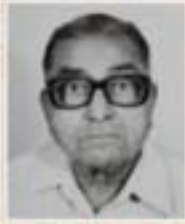
૧૯૧૨ થી ૧૯૬૩