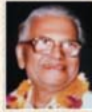
૧૯૧૮ થી ૧૯૬૯