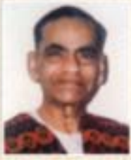
૪૫. શ્રી ડૉ. ડૉ. રાઠ ૧૯૭૧ થી ૧૯૭૩