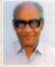
૧૯૧૬ થી ૧૯૬૭