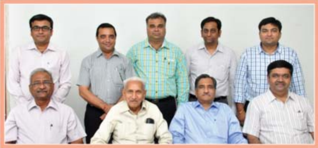
Board of Directors