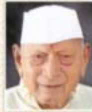
૧૯૧૩ થી ૧૯૬૪