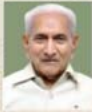
૧૯૧૭ થી ૧૯૬૮