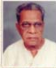
૧૯૧૪ થી ૧૯૬૫