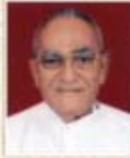
૧૯૧૯ થી ૧૯૭૦