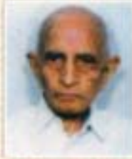
૧૯૧૧ થી ૧૯૬૨